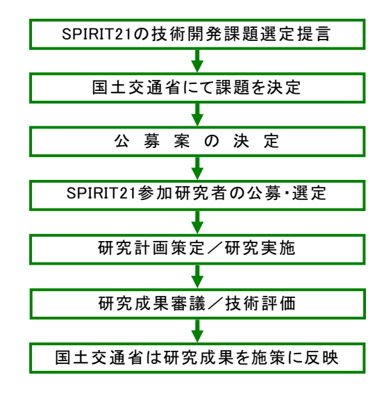
図1 SPIRIT21 実施フロー

このような背景のもと、下水道に関する様々な課題の内、特に重要なものについて、国土交通省のリードのもと、産学官の強力な連携によって集中的に技術開発を実施する下水道技術開発プロジェクト「SPIRIT21(Sewage Project Integrated and Revolutionary Technology for 21 century)」が平成14年に創設された。